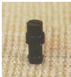
WFS110° 0951 ~ 0956 缝隙式 型塑料微喷头 6 P=100 ~ 300kpa D=1.4 ~ 6.8m Q=21 ~ 400L/h