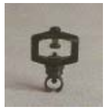
WZSY/WZSX 0141 ~ 0265 折射式全圆/线状微喷头 6 P=100 ~ 300Kpa D=3.6 ~ 6.6m Q=42 ~ 360L/h