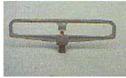
WZX 0361 ~ 0375 折射式锌铝合金微喷头 M8 P=100Kpa D=1.2 ~ 2.0m