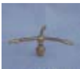
WXTC -3 0871 旋转 三臂铜微喷头 1/2 P=100 ~ 150kpA D=7 ~ 11m P=150 ~ 680 L/h Q=150 ~ 680L/h