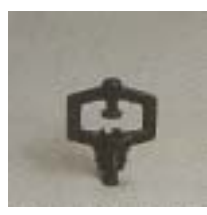
WZSY/WZSX 0131 ~ 0235 折射式全圆/线状微喷头 6 P=100 ~ 300Kpa D=3.6 ~ 6.6m Q=42 ~ 360L/h