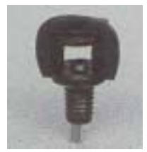
WZSY/WZSX 0111 双向折射式微喷头 3 P=70 ~ 350Kpa D=(1 ~ 2.2)x(1 ~ 2.0)m Q=18 ~ 32L/h