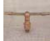
WXTC -1 0856 旋转长臂 型单喷嘴微喷头 1/2 P=100 ~ 150kpA D=9.2 ~ 12.0m P=130 ~ 350 L/h Q=130 ~ 350L/h