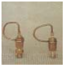
WZT 0301 ~ 0315 折射式铜微喷头 M8 P=100 ~ 200Kpa D=2.0 ~ 5.3m Q=20 ~ 112L/h