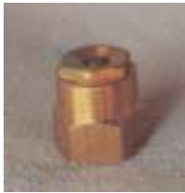
WLTT 0612 离心式可调铜微喷头 1/2 P=75 ~ 250kpa D=3.0 ~ 9.0m Q=140 ~ 740L/h