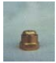
3376 ~ 0385 铜微喷头 1/2 P=105 ~ 210Kpa D=1.83 ~ 4.26m Q=79.5 ~ 590L/h