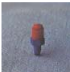
WFSL 1101 ~ 1105 缝隙式水线塑料微喷头 M5 P=100 ~ 300kpa D=1.1 ~ 8.4m Q=14 ~ 219L/h