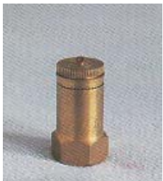
WFSX/WFTX 1081 ~ 1096 缝隙式内螺纹水线微喷头 1/2 P=100 ~ 300kpa D=3.8 ~ 7.5m Q=166 ~ 884L/h