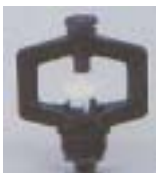
WXSL 0781 ~ 0795 旋轮 型微喷头 M8 P=100 ~ 200kpA D=3.2 ~ 7.0m Q=20 ~ 140L/h