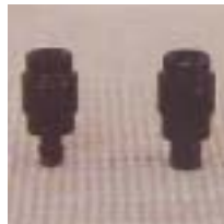
WLS 、 0501 ~ 0414 离心式塑料 、 型微喷头 M8 6 P=75 ~ 250kpa D=1.5 ~ 4.6m Q=60 ~ 213L/h