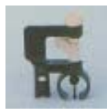
WXSB 0731 ~ 0755 旋臂式 型微喷头 6 P=100 ~ 200kpA D=3.2 ~ 7.0m Q=34 ~ 215L/h