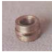
WLT 0441 ~ 0454 离心式不锈钢 型微喷头 1/2 P=75 ~ 250kpa D=3.0 ~ 9.0m Q=140 ~ 740L/h