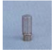
WLTT 0641 畜牧消毒不锈钢微喷头 M8 P=100 ~ 200kpa D=1.0 ~ 2.0m Q=26 ~ 44L/h