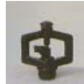
WXSB 0711 ~ 0715 旋臂式 型微喷头 3/8 P=100 ~ 200kpA D=3.5 ~ 7.6m Q=27 ~ 215L/h