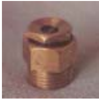
WLTT 0611 离心式可调铜微喷头 1/2 P=75 ~ 250kpa D=3.0 ~ 9.0m Q=140 ~ 740L/h