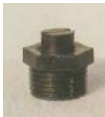
WFS110° 0921 ~ 0926 缝隙式 型塑料微喷头 1/2 P=100 ~ 300kpa D=1.4 ~ 6.8m Q=21 ~ 408L/h