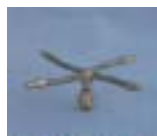
WXTC -4 0881 旋转 四臂铜微喷头 1/2 P=100 ~ 150kpA D=7 ~ 10m P=240 ~ 650 L/h Q=240 ~ 650L/h