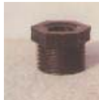
WLS 0401 ~ 0414 离心式塑料 型微喷头 1/2 P=75 ~ 250kpa D=3.0 ~ 9.0m Q=140 ~ 740L/h