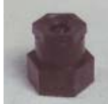
WLST 0602 离心式塑料微喷头 1/2 P=75 ~ 250kpa D=3.0 ~ 9.0m Q=140 ~ 740L/h