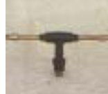
WXTC -2 0841 ~ 0855 旋转长臂 型双喷嘴微喷头 1/2 3/8 P=100 ~ 200kpA D=9.2 ~ 12.0m P=124 ~ 305 L/h Q=124 ~ 305L/h