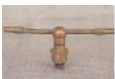
WXTC -2 0861 旋转长臂 型单喷嘴微喷头 1/2 P=100 ~ 150kpA D=9.2 ~ 12.0m P=130 ~ 580 L/h Q=130 ~ 580L/h