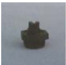
WFS110° 0921 ~ 0926 缝隙式 型塑料微喷头 3/8 P=100 ~ 300kpa D=1.4 ~ 6.8m Q=21 ~ 400L/h