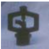
WXSB 0701 ~ 0705 旋转式 型微喷头 1/2 P=100 ~ 200kpA D=3.5 ~ 8.6m Q=27 ~ 215L/h