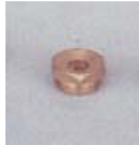
WLT 0471 ~ 0474 离心式铜 型微喷头 3/8 P=75 ~ 250kpa D=3.0 ~ 9.0m Q=140 ~ 740L/h