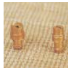
WFT110° 0981 ~ 0986 缝隙式 型铜微喷头 6 P=100 ~ 300kpa D=1.4 ~ 6.8m Q=21 ~ 408L/h