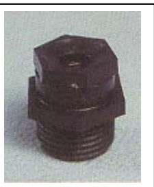
WLST 0601 离心式塑料微喷头 1/2 P=75 ~ 250kpa D=3.0 ~ 9.0m Q=140 ~ 740L/h