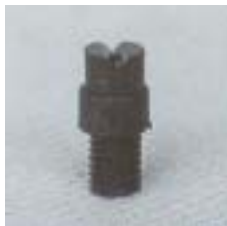
WFS110° 0941 ~ 0946 缝隙式 型塑料微喷头 M8 P=100 ~ 300kpa D=1.4 ~ 6.8m Q=21 ~ 400L/h