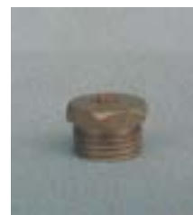
WFT110° 0961 ~ 0966 缝隙式 型铜微喷头 1/2 P=100 ~ 300kpa D=1.4 ~ 6.8m Q=21 ~ 408L/h