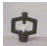
WXSL 0771 ~ 0775 旋轮式 型微喷头 3/8 P=100 ~ 200kpA D=3.2 ~ 7.0m Q=20 ~ 140L/h