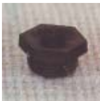
WLS 0461 ~ 0464 离心式塑料 型微喷头 3/8 P=75 ~ 250kpa D=3.0 ~ 9.0m Q=140 ~ 740L/h