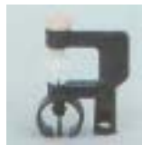
WXSL 0801 ~ 0815 旋轮式 型微喷头 6 P=100 ~ 200kpA D=3.2 ~ 7.0m Q=20 ~ 140L/h