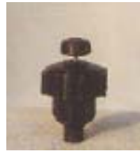
WZSN 0291 ~ 0295 折射式水伞微喷头 M8 P=100 ~ 200Kpa D=3.8 ~ 7.0m Q=130 ~ 330L/h