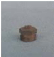
WFT110° 0971 ~ 0976 缝隙式 型铜微喷头 3/8 P=100 ~ 300kpa D=1.4 ~ 6.8m Q=21 ~ 408L/h