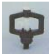
WXB 0721 ~ 0725 旋轮 型微喷头 M8 P=100 ~ 200kpA D=3.5 ~ 7.6m Q=38 ~ 215L/h