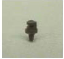
3 P=70 ~ 350Kpa D=(1 ~ 2.5)x(1 ~ 5)m Q=18 ~ 163L/h