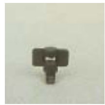
WZSS 0112 ~ 0115 双向折射式微喷头 3 P=70 ~ 350Kpa D=(1 ~ 3.5)x(1 ~ 4)m Q=18 ~ 163L/h