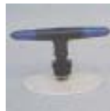
WXSC -1 0821 ~ 0835 旋转长臂 型双喷嘴微喷头 1/2 3/8 P=100 ~ 200kpA D=9.2 ~ 12.0m P=124 ~ 305 L/h Q=124 ~ 305L/h