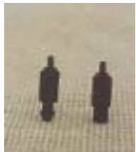
WZSZ/WZTZ 0320 ~ 0349 折射式轴心全圆微喷头 M8 6 P=100 ~ 200Kpa D=3.8 ~ 7.0m Q=49 ~ 285L/h