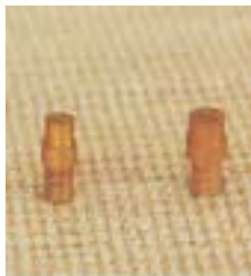
WFT110° 0981 ~ 0986 缝隙式 型铜微喷头 M8 P=100 ~ 300kpa D=1.4 ~ 6.8m Q=21 ~ 408L/h