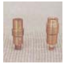
WLT 、 0471 ~ 0474 离心式铜 、 型微喷头 M8 6 P=75 ~ 250kpa D=1.5 ~ 4.6m Q=60 ~ 213L/h