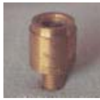
WLTT 0613 离心式可调铜微喷头 M10 P=75 ~ 250kpa D=3.0 ~ 9.0m Q=140 ~ 740L/h