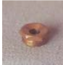
WLT 0421 ~ 0434 离心式铜 型微喷头 1/2 P=75 ~ 250kpa D=3.0 ~ 9.0m Q=140 ~ 740L/h