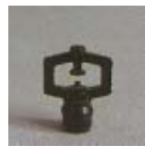
WZSY/WZSX 0171 ~ 0285 折射式全圆/线状微喷头 1/2 3/8 P=100 ~ 300Kpa D=3.6 ~ 6.6m Q=42 ~ 360L/h