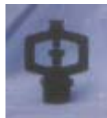
WXSL 0761 ~ 0765 旋轮 型微喷头 1/2 P=100 ~ 200kpA D=3.2 ~ 7.0m Q=20 ~ 140L/h